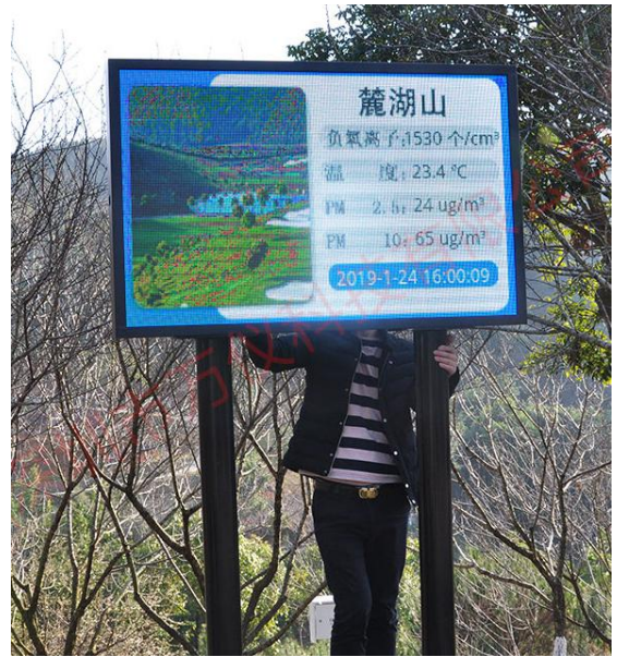
全彩屏+双立柱固定